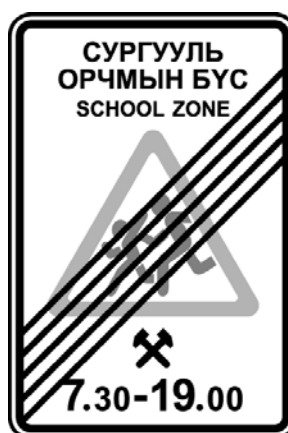
2-р зураг - 5.26 - Сургууль орчмын бүсийн төгсгөл

4.1.4 Сургууль орчмын бүс доторх огтлолцсон зам төгсөхөд (5.25, 5.26) тэмдгийг сургуулийн бүсэд тууш зам дээр Т хэлбэрийн уулзварын төгсөлийн эсрэг талд байрлуулна. Замын хөдөлгөөний дүрмийн дагуу сургуулийн бүсийг дараах байдлаар тодорхойлоно. Үүнд: