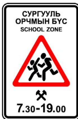
1-р зураг - 5.25- Сургууль орчмын бүсийн эхлэл